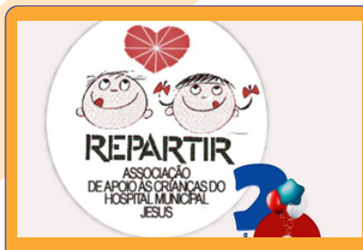
Logotipo Repartir Associação de Apoio às Crianças do Hospital Municipal Jesus