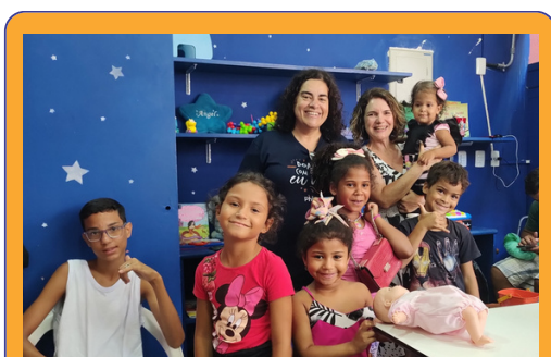
Dia da visita do Instituto Phi no Refazer.

A boa notícia: nosso projeto foi aprovado e receberá mais um ano de patrocínio!