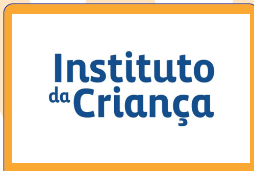
Logotipo do Instituto da Criança