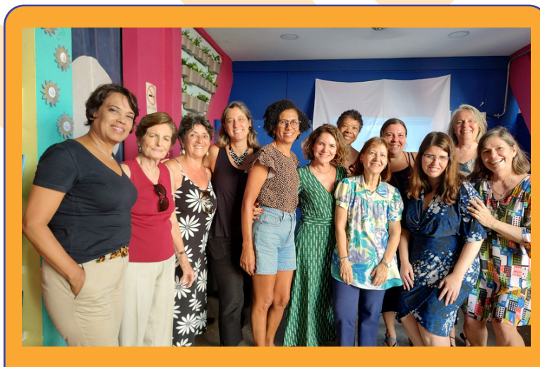
Confraternização com os voluntários.

Vamos em frente, porque juntos podemos mais, podemos Refazer!