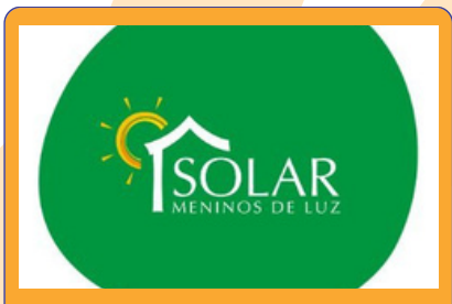
Logotipo do Solar Meninos de Luz

Refazer, Repartir e Responder irão se reunir no dia 15/03 para aumentar a troca de experiências e identificar possíveis sinergias.