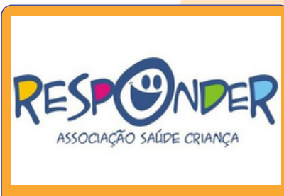
Logotipo Responder Associação Saúde Criança