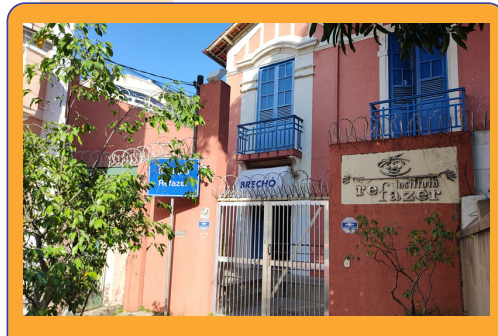
Sede do Instituto Refazer

Começamos o ano nos reunindo com o Conselho Consultivo para apresentar o novo portfólio de projetos de captação de recursos, alinhado com a Agenda ESG. O portfólio foi aprovado por unanimidade pelo Conselho!