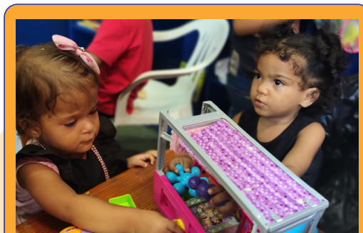
A representante do Instituto Phi conheceu o dia a dia do trabalho desenvolvido pelo Instituto.