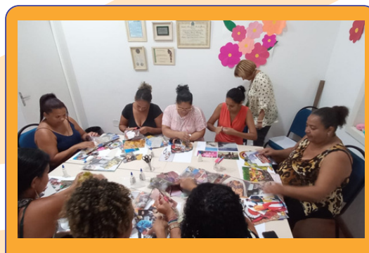
As famílias em ação na Arteterapia.