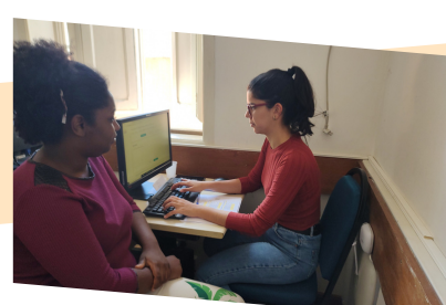
Nossos voluntários em ação