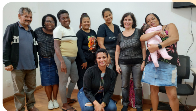
Começando a oficina bem-estar