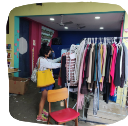
No dia 15 de junho aconteceu na sede do Refazer o Brechozão de Inverno