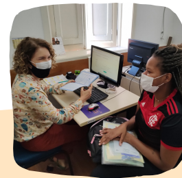
Atendimento do Plano de Ação Familiar (PAF) no Refazer