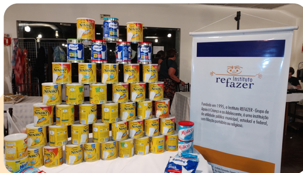
Arrecadação de Leite em pó no Bazar da Mães

Agradecemos também o Instituto ProFarma, nosso parceiro, que junto com a Piracanjuba forneceram leite em pó.