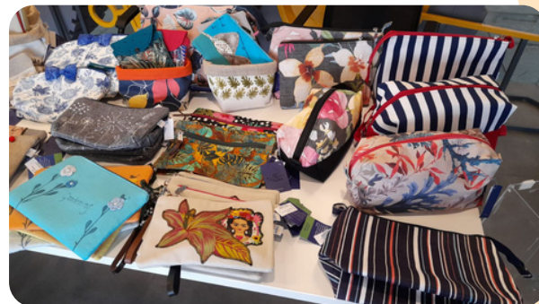
Os produtos da Grife Refazer na Vale em Botafogo