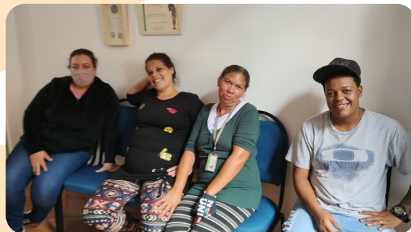
As famílias durante as palestras do Programa Prevenção