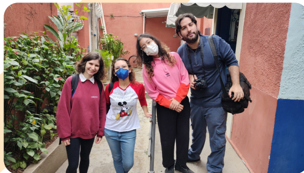
Dia de gravação do documentário sobre o Refazer com os estudantes de cinema da Facha