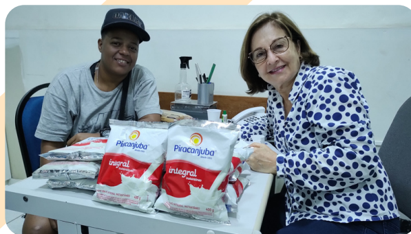
Entrega do leite em pó integral