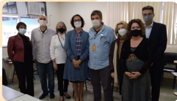
Reunião do Conselho Consultivo