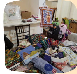
O Bazar das Mães no late Clube foi um sucesso de público